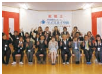
マイスカイ中山 竣工式 2012年3月28日

スタッフ一同、ご利用様が「こころやすらぐ時間」を過ごせますよう精一杯おもてなしをいたします。ぜひ、ご連絡・ご相談下さいますよう申し上げ、挨拶とさせていただきます。