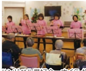
ハンドベル愛好会 さくら 様 (ハンドベル演奏)