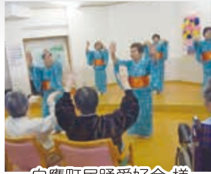
白鷹町民踊愛好会 様 (踊り)