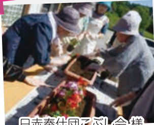
日赤奉仕団こぶし会 様 (花植え、雑巾縫いなど)