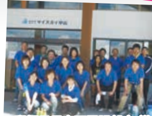
郵便局長会西置賜部会 様 (怒ふぎ)