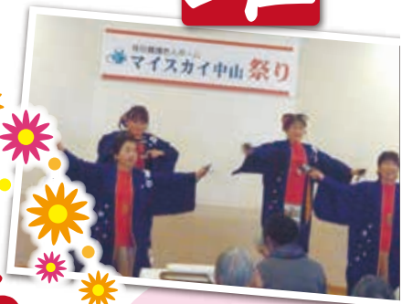
いえ～い！！ 盛り上がりました！