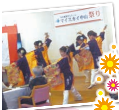
よさこい 白鷹櫻鷹会の みなさん