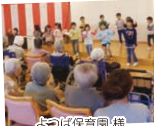
よつば保育園 様 (かわいい歌、踊りなど)