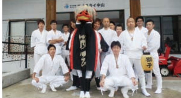
文化継承団体獅伝様 (獅子舞)

昨年11月27日、文化継承団体獅伝様に来所していただき、獅子舞をご披露していただきました。利用者の皆様は「久しぶりにお獅子見た!」と大喜びでした。 このように素晴らしい伝統をこれからも継承して頂きたいと思ひます。