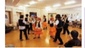
白鷹町フォークダンス会様 (フォークダンス)