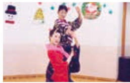
白鷹花柳会様 (日本舞踊)

昨年11月27日、文化継承団体獅伝様に来所していただき、獅子舞をご披露していただきました。利用者の皆様は「久しぶりにお獅子見た!」と大喜びでした。 このように素晴らしい伝統をこれからも継承して頂きたいと思ひます。