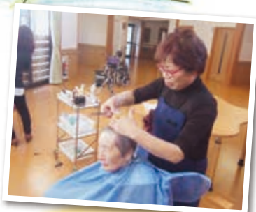
月に一度の床屋さん