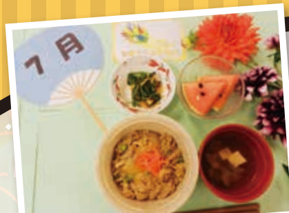
7月の誕生日食 牛丼のリクエストでボリューム満点