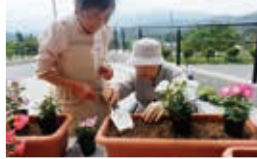
こぶし会日赤奉仕団様 (花植え、雑巾縫い等)