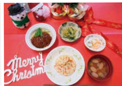
洋風メニューでメリークリスマス

今年度の食事は、新メニューと誕生日食の提供に力を入れています。新メニューについては定期的に新しいメニューを提供し、変化を持たせています。誕生日食については、利用者の方の食べたい物や好きなものを聞き取り提供しています。その方の嗜好だけでなく、生活の様子を垣間見ることができます。その他に、季節に合わせた食事の提供や行事を企画し、季節の流れを感じていただいています。日々の食事も含め意見を出し合って、利用者の方に楽しみにしていただける食事作りに努めています。