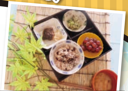
お盆メニュー 鯉の甘露煮は人気メニューの1つです