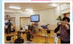
三人会様 (ハーモニカ・尺八)