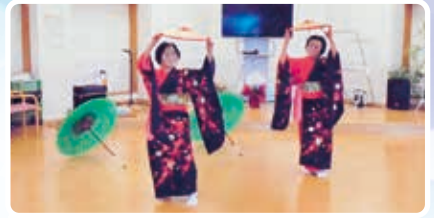
コスモス会様(踊り)