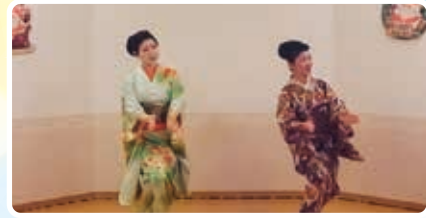
白鷹花柳会様(日本舞踊)